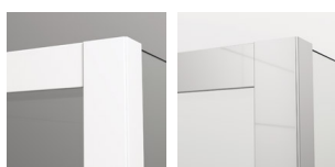
09 WHITE LINE 50 Srebrny połysk